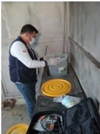
Vigilancia y toma de muestras de la Calidad del Agua en el C.P.El Dorado