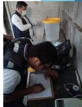
Vigilancia y toma de muestras de la Calidad del Agua en el C.P.Ex Petroleros