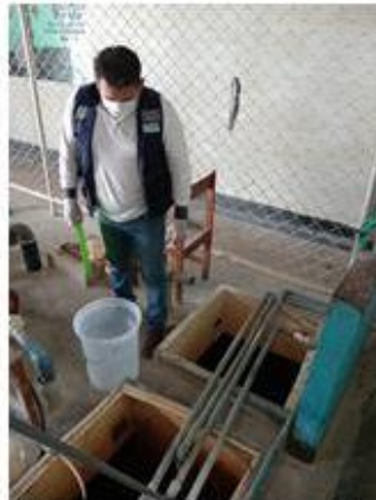
Vigilancia y toma de muestras de la Calidad del Agua en el C.P Los Delfines